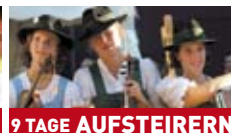
9 TAGE AUFSTEIRERN